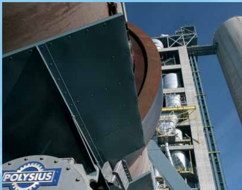
Préchauffeur DOPOL® '90 avec système de précalcination PREPOL®-CC-MS pour une production de 2600 t/j de clinker en Espagne.

Ces investigations permettent de garantir une adaptation optimale des systèmes et des composants.