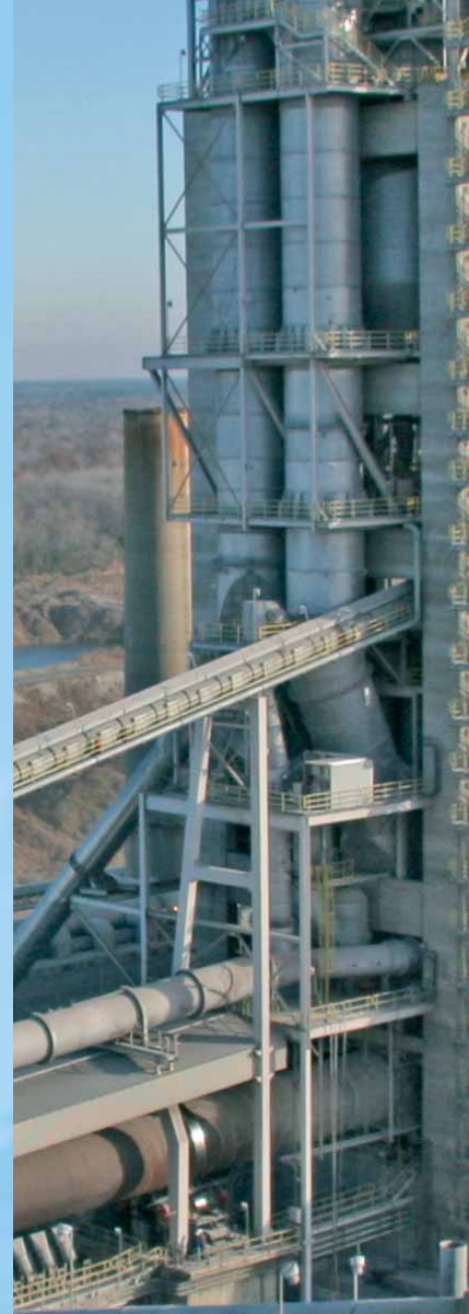
Système PREPOL®-MSC-CC – installé aux USA.

La chambre de combustion particulière, reliée par une conduite de gaz à la lyre de précalcination, est la caractéristique principale du PREPOL®-CC. La possibilité d'influencer la température de combustion garantit un rendement élevé du précalcinateur en cas d'utilisation de combustibles solides.